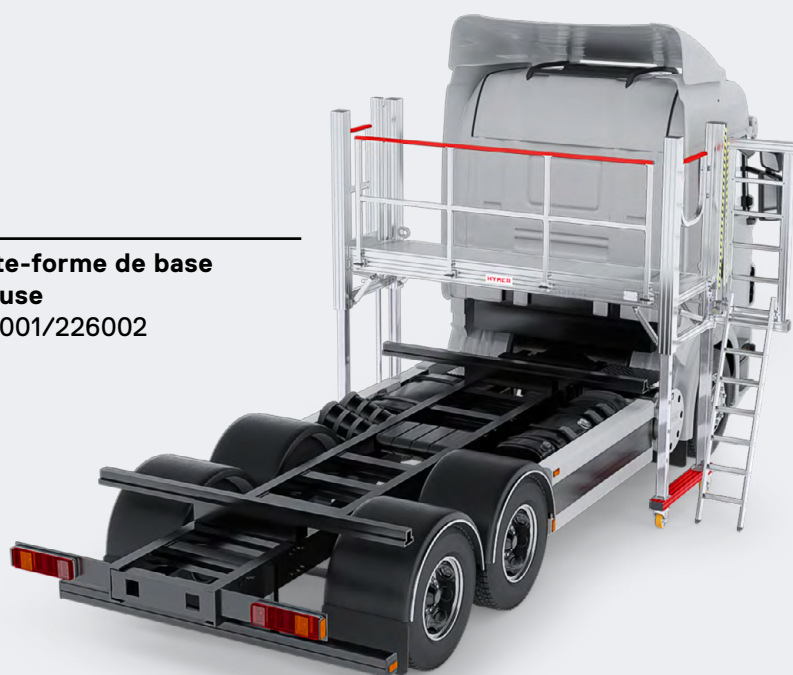
Plate-forme de base incluse 226001/226002